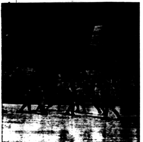
Di Solo berore-oreo in telah berdirikan 'toegoe' Toegoe Peringatan waktoe Balatantara Dai Nippon...