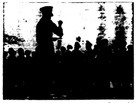
Depatjara pedirian Toegoe Peringatan di Solo (ditepi Bangunan Solo) ialah oentek peringatn bala Balatantara Dai Nippon...

djalankan oeroesan Pemerintahan 'Si' menoeroet kekoemasaan yang diserahkan kepadanja oleh 'Si-tyoo'.